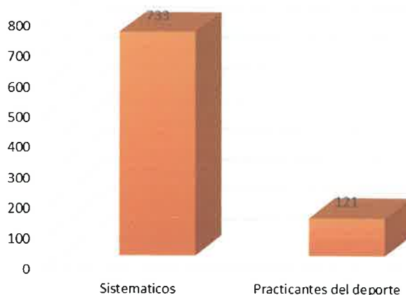
Título del gráfico