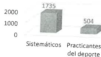
Título del gráfico