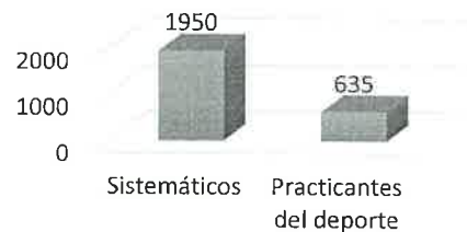
Título del gráfico